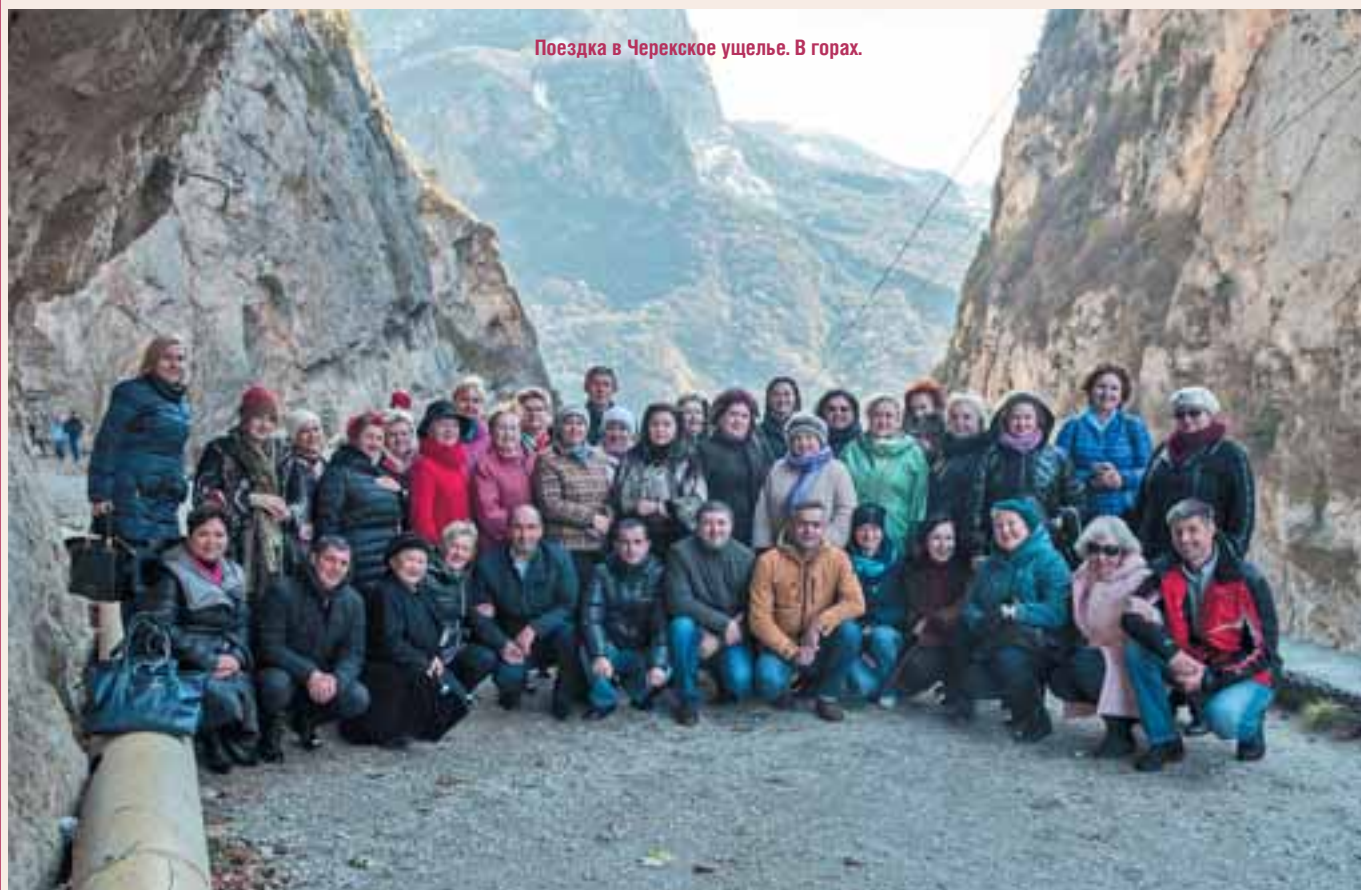
Поездка в Черекское ущелье. В горах.

Об основных критериях формирования личного имиджа деловой женщины рассказала участникам Форума пресс-секретарь