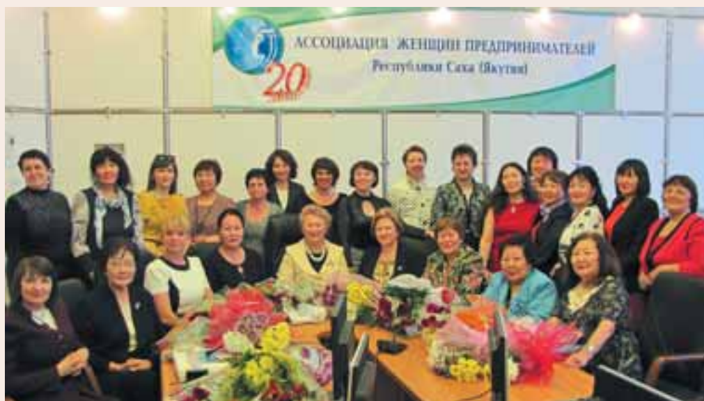
Региональному отделению АЖПР в Республике Саха (Якутия) 20 лет. 2013 г.

Каждая женщина-предпринима-тель оказывает огромную помощь в населённом пункте, где она про-живает. Как правило, ни одно меро-приятие не обходится без её