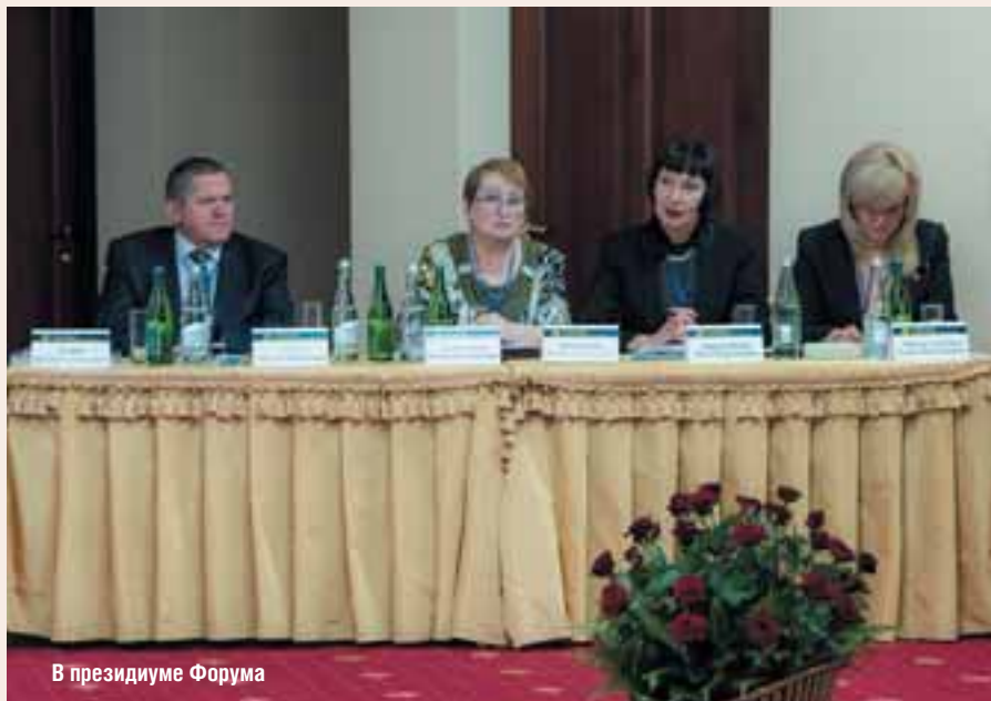
В президиуме Форума

28-29 октября 2016 года в городе Нальчике, столице Кабардино-Балкарской Республики, состоялся Первый общероссийский женский бизнес-форум «Роль деловой женщины в социально-экономическом развитии региона»