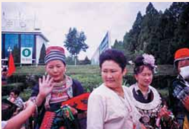
КНР. X Всемирный конгресс женщин. 1995 г.