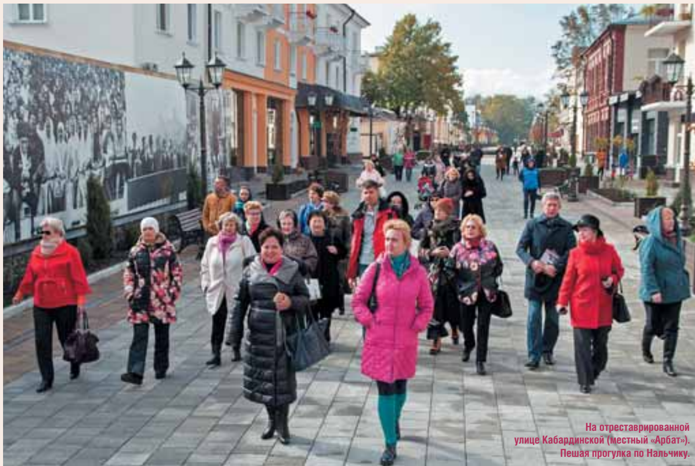
На отреставрированной улице Кабардинской (местный «Арбат»). Пешая прогулка по Нальчику.