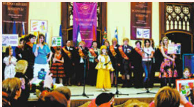
2009 г.