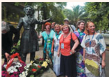
Недавно делегация женщин-предпринимателей Республики Башкортостан приняла участие в праздновании дня рождения А.С. Пушкина в городе Подгорица – столице Черногории. Праздник прошёл возле памятника великому русскому поэту.